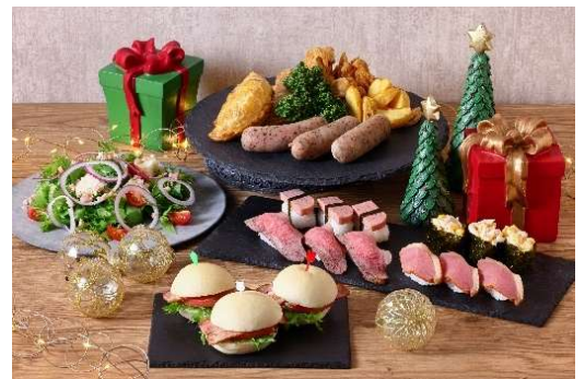
クリスマスパーティーセット （イメージ。料理は 3 名分。）

※ご予約いただきましたお受け取りのお時間より遅れる場合には事前にご連絡をお願いいたします。