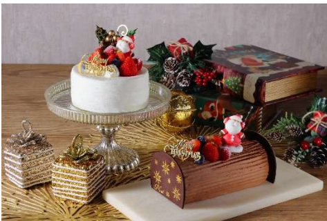
選べる 2 種のクリスマスケーキ（イメージ）

（左）クリスマスケーキ（苺ショートタイプ、直径約 12cm） ふわふわのスポンジで苺と、くちどけの軽い優しい甘さの生クリームをサンドしています。