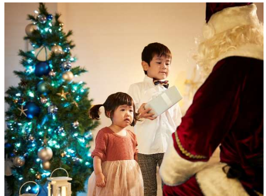
サンタがお部屋にやってくる！（イメージ）