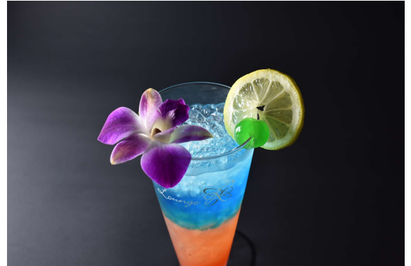
レインボーカクテル（イメージ）