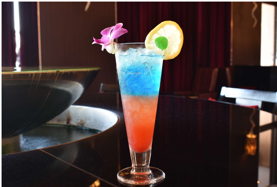
ラウンジR 「レインボーカクテル」

Pride Month 限定カクテルの提供と LGBTQ+セミナーを通じ、安心できる滞在環境を