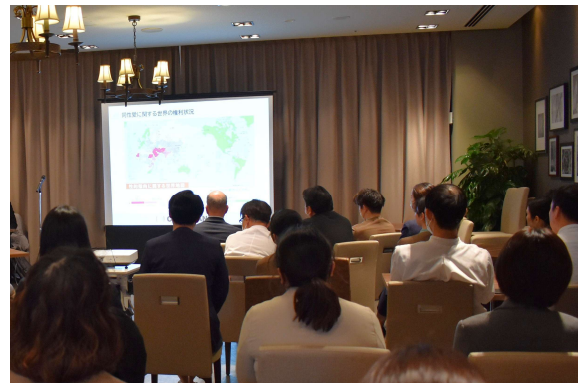
セミナー受講の様子

LGBTQ+ セミナーをホテル ユニバーサル ポートおよびホテル ユニバーサル ポート ヴィータの両館クルーが参加し受講しました。セミナーでは、LGBTQ+ についての基本知識や接遇方法をご教示いただきました。このセミナーの受講により大阪観光局より「LGBTQ フレンドリーホテル」として認定を受け世界中からお越しくくださる多様なゲストのみなさまにさらに心地よい滞在を感じていただけるようこれからも意識向上に努めて参ります。