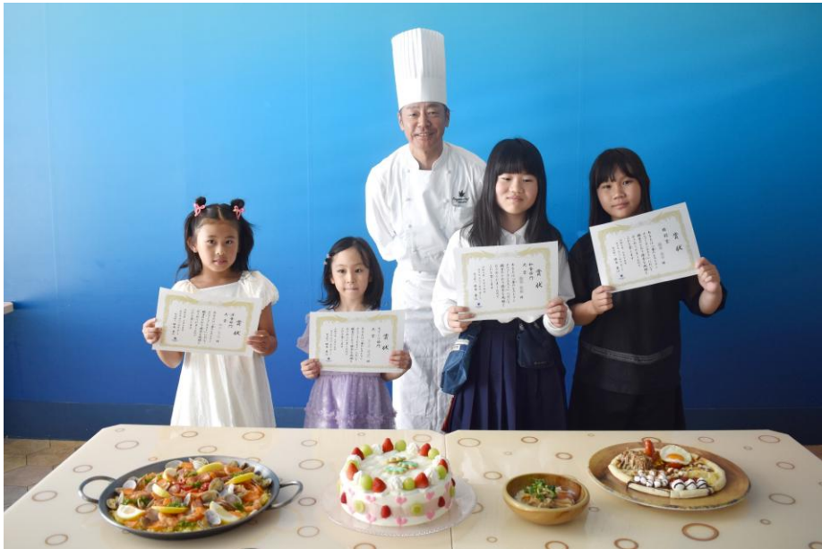
「夢のレストランメニューコンテスト」表彰式の様子 (ホテル ユニバーサル ポートにて)