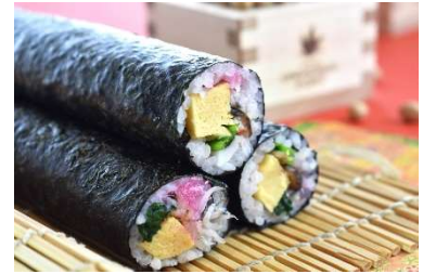
ホテルオリジナル恵方巻（イメージ）

恵方巻は、縁起が良いとされる「七福神」に由来し、七種類の具材を巻くのが一般的とされています。七種類の具材を巻くことには「福を巻き込む」、食べることに「幸運を取り込む」といった意味が込められています。当ホテルで提供する恵方巻には、大阪府内で漁獲された「しらす」と、此花区で水耕栽培により育てられた「ほうれん草」を使用しています。