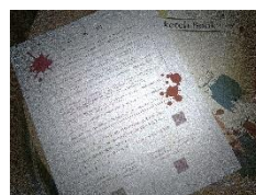
謎解きツール (過去開催分のイメージ)

主人公である植物学者をテーマに「植物・生物」に関連する謎、ミッションで物語へ没入させる。 (イメージ)