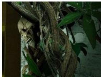
研究室を侵食する不気味な植物。全てを飲み込むタイムリミットが近づいている……！