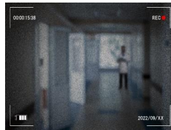
防犯カメラに映る男は誰なのか。父の失踪に関係しているのは間違いなさそうだ。