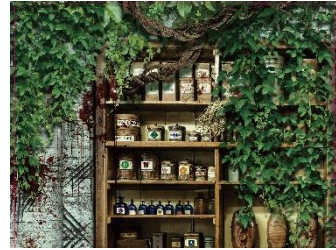
スマートフォンで視聴する動画と室内がリンクし、ストーリーがすすむ。(イメージ)

めめます。ヒントはスマートフォンで視聴する動画と室内に存在します。室内に散在する顕微鏡・試験管などのアイテムを使用する“化学実験”を模した行動が必要な場面や、光や触感などを手がかりとする仕掛けも用意しています。また、室内には HDMI ケーブルをご用意しています。ご自身のスマートフォンとテレビを接続し、大きな画面で楽しむことが可能※です。