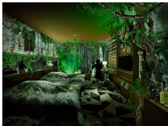
客室の設定は「異形の植物が蔓延る研究室」(イメージ)

「謎のクオリティ」と「物語へのイマーシブ(没入感)」にこだわり、常に前作を超える作品とすべく趣向を凝らし、2015 年より、隣接するシスターホテル「ホテル ユニバーサル ポート」にて展開する「謎解きホラールーム」シリーズ。本作は、両館あわせて第 8 弾になります。