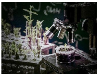
室内に散在する、倫理に反する実験の痕跡。父はここで一体何を研究していたのか。