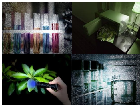
室内にあるアイテムなどを使い、隠された手掛かりを探し出す。(イメージ)

「リアルな体験をすることによる、物語へのイマーシブ」をテーマに、室内の装飾は植物を用いた環境・空間演出を手掛ける専門会社がデザインから施工までを担当。“本物”と見紛うばかりの樹木の作り込みで作り上げられた「植物に侵食された研究室」の中、宿泊者が“物語が現実である”かのように感じることができるよう、ただ謎を解くだけではなく、動く・触る・感じるという「リアルな体感」を伴うことにより、謎を解き明かすことができる構成にしています。