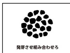
発芽させ組み合わせろ

主人公である植物学者をテーマに「植物・生物」に関連する謎、ミッションで物語へ没入させる。 (イメージ)