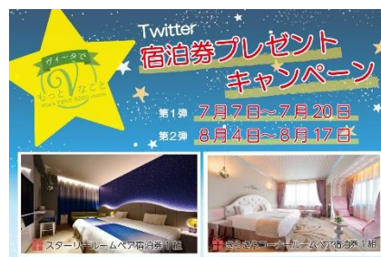
SNS キャンペーン イメージ

当ホテルのコンセプトルーム「スターリールーム」と「きらきらコーナールーム」の宿泊券が当たる SNS キャンペーンを実施します。ホテル公式ツイッターの指定投稿をフォロー&リツイートしていただいた方を対象に抽選いたします。詳しくはホテル公式ウェブサイトをご覧ください。 https://www.u-vita.co.jp