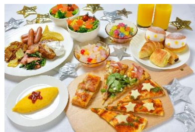
朝食ビュッフェ 期間限定料理 イメージ

お星さまが散りばめられたイメージのメニューが並ぶ朝食ビュッフェです。星型チョコのマリトッツォや星型チーズの石窯焼きピッツァなど、星を見つけながら朝食をお楽しみいただけます。