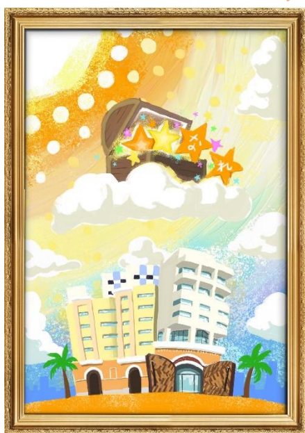
不思議なスターリーポスター 「太陽とホテルとお星さま」 ポスターを左側から見た時のイメージ