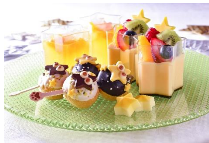
スターリースイーツ イメージ

【客 室】 スターリールーム、スターリーコーナールーム、きらきらコーナールーム、プリズムタイプ（上層階）のスタンダードルーム・スーパーリアルーム・デラックスルーム