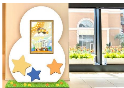
不思議なスターリーポスター 掲出イメージ