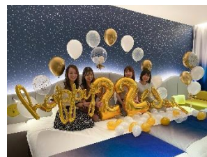
バルーン装飾 イメージ（左：キッズバースデー 上：アニバーサリー 下：バースデー）