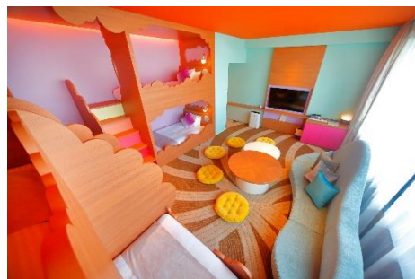
レインボールーム