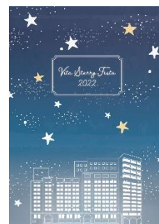
スターリーフェスタ オリジナルノート イメージ