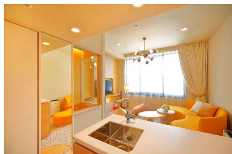
もこもこメゾネット（リビング）