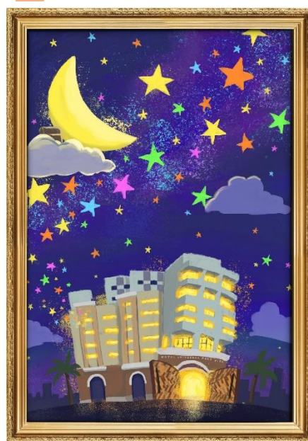
不思議なスターリーポスター 「太陽とホテルとお星さま」 ポスターを右側から見た時のイメージ