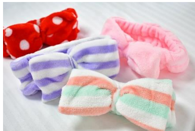
ふわふわリボン型ヘアバンド