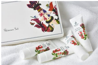
「カルトウージア」スキンケアセット

※その他、対象客室にはクレンジング、フェイスソープ、ジェルアイマスク、入浴剤などのアメニティを常時ご用意しています。