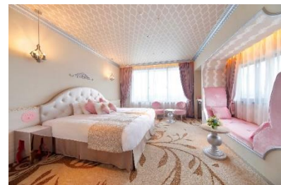
きらきらコーナールーム

ピンクとシルバーのテイストに彩られたコーナールーム。窓側のソファでくつろぎながら眼下の安治川を行き交う船や、夜には天保山の観覧車のライトアップが望めます。ウォークインクローゼット、洗面台が2つあるパウダールームやテレビ付きバスルームなど快適な設備が充実しています。