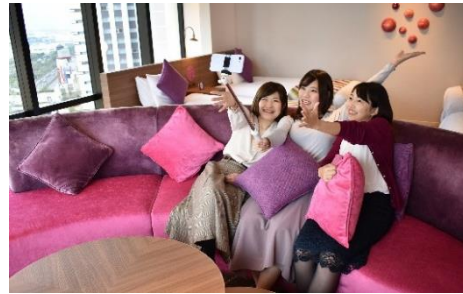
自分撮りイメージ

本プランは、女性らしい家具や色合いで写真映えする「きらきらコーナールーム」（44㎡）と当館で一番の広さと設備を誇る「スパークルルーム」（70㎡）の客室を対象に、スマートフォン用三脚をはじめ、スキンケア用品、ストレートヘアアイロンなどをお部屋にご用意した、女子旅にぴったりの宿泊プランです。