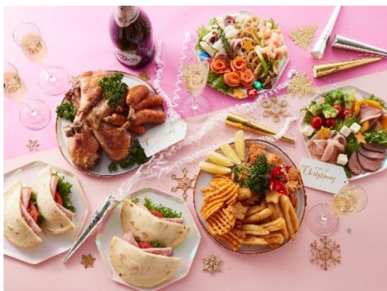
クリスマスメニュー (イメージ)

クリスマスならではの“七面鳥”を燻製した「スモークターキーレッグ」や「骨付きフランク」「パストラミと野菜のピタパンサンド」をはじめ、ローストビーフやシーフードを使った彩り華やかなオードブルまで、クリスマス感あふれる12種類の料理とスパークリングワイン1本をお部屋にお届けするプランです。“客室”というプライベート空間で、心おきなくクリスマスパーティーをお楽しみいただけるプランです。