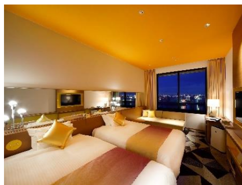
客室一例 ホテル ユニバーサル ポート ヴィータ 「ヴィータ スーペリアツイン（プリズム）」（イメージ）