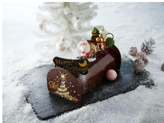
ブッシュドノエル (イメージ)