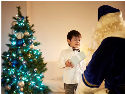
サンタに会えるクリスマス！宿泊プラン（イメージ）

「サンタに会えるクリスマス」が実現する、1日10室限定の宿泊プランです。“サンタクロースの自宅”をテーマに装飾を施した客室「サンタルーム」にお客さまをご招待し、約15分間グリーティングをお楽しみいただけます。また、事前にホテルにお預けいただいたクリスマスプレゼントなどをサンタクロースからご指定の同行者の方にお渡しします。お子さまや恋人など、大好きな人の笑顔に出会える心あたたまるクリスマスを演出します。