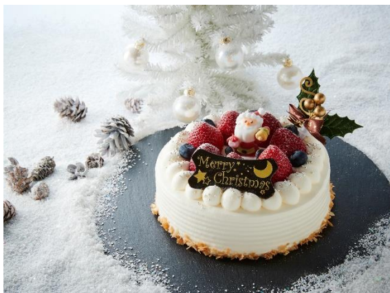
苺ショートケーキ (イメージ)

パティシエが心を込めて仕上げる 2 種のクリスマスケーキより 1 種をお選びいただき、お部屋にお届けするプランです。しっとりふわふわなスポンジと優しい甘さの苺ショートケーキと、濃厚で華やかな香りが魅力のキャラメルマンゴームースが隠れたブッシュドノエルの 2 種をご用意しています。