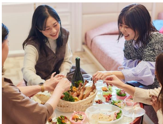
クリスマスメニュー付き宿泊プラン (イメージ)