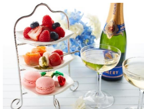
シャンパン&オードブル付き宿泊プラン (イメージ)

その他、恋人、ご夫婦でのクリスマスステイにおすすめの、スモークサーモンとカプレーゼ、ラズベリーのマカロンやフルーツなどのデザートとシャンパーニュが楽しめる「シャンパン&オードブル付き宿泊プラン」もご用意しています。