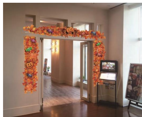
◀▲ビュッフェレストラン「ポートダイニング リコリコ」もハロウィーンの装いに。たくさんのジャック・オ・ランタンに囲まれ、ハロウィーン感いっぱいの中、秋の味覚を楽しめる。