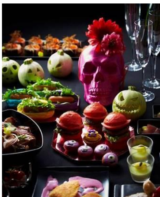
ポートダイニング リコロコ ディナービュッフェ 「秋の味覚とハロウィーンフェア」イメージ

今年のテーマは、怖くておかしいという意味の「Spooky（spooky と funny を合わせた造語）」。ビュッフェレストラン、ラウンジ、カフェでは、今にも“ちょこまか”と動き、しゃべり出しそうなキュートなお化けやモンスターなどをアイコンにしたメニューが登場します。ジャック・オ・ランタンなどを用いた館内装飾やハロウィーンにまつわる投稿で宿泊券などが抽選で当たる SNS フォロー&投稿キャンペーンも開催します。