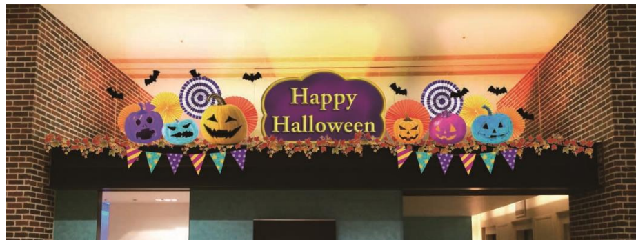
▲ロビーにはカラフルなジャック・オ・ランタンやコウモリがデコレーションされ、絶好のフォトスポット。