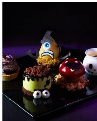
レックスカフェ 「ハロウィーンスイーツ」 イメージ

「ハロウィーンパーティセット付き宿泊プラン」は、真っ黒なパンが印象的なサンドイッチやミイラの骨付きソーセージなど、“怖くておかしい”10種の料理とスパークリングワインが楽しめ、仮装用のマント、またはハットが付いて、パーティにぴったりです。