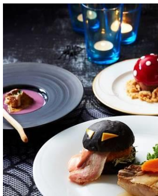
ラウンジR 「ハロウィーンディナーセット」 イメージ