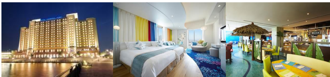
TM & © 2019 Universal Studios. CR19-0155