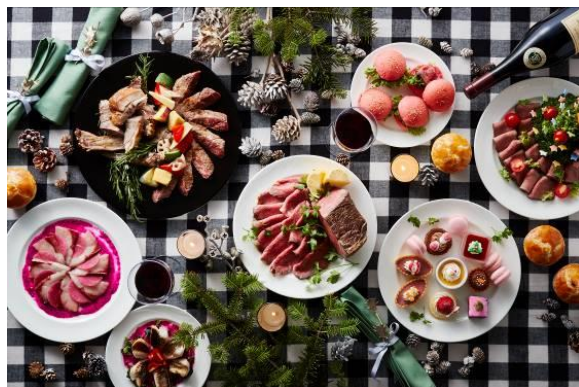
「ローストビーフとクリスマスフェア ディナーbuffet」イメージ

館内のbuffetレストラン「ポートダイニング リコリコ」では、「ローストビーフとクリスマスフェア ディナーbuffet」を開催。シェフ特製のローストビーフのほか、ピンクの食材を使用した華やかな色合いの料理など、クリスマス盛り上げるメニューが並びます。館内3つの飲食施設が、それぞれ特徴のあるクリスマスメニューを展開します。