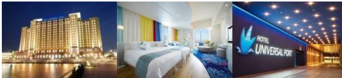
TM & © 2018 Universal Studios. CR18-2839