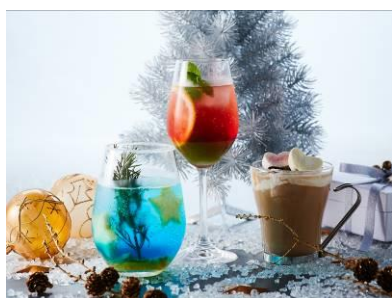
(左) Holy Night 1,000円 (中) Winter Bell 900円 (右) Choco Latte（ノンアルコール） 800円 ※税・サ込み

星降る冬の夜空をイメージしたカクテルや、苺リキュールを使用した真っ赤なカクテルなど、クリスマスの夜にゆったりと味わいたいカクテル（3種）です。