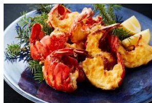
オマール海老のグラタン