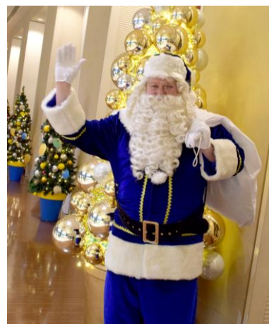
2017年「サンタグリーティング」より

また、サンタクロースがお部屋までプレゼントをお届けするプランや、お部屋で特別料理付きのクリスマスパーティがお楽しみいただけるプランなど、クリスマスならではの宿泊プランをご用意します。